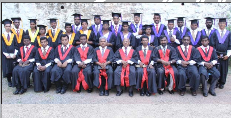
അസൂലഭ നിമിഷം... ബിരുദധാരികൾ വിശിഷ്ട അതിഥികൾക്കും അദ്ധ്യാപകരോടും ഒപ്പം