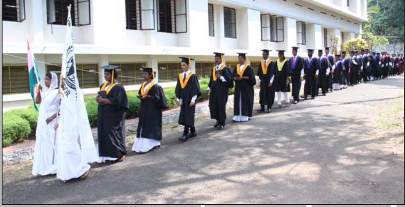
ക്രിസ്തുവിനായ് മുന്നോട്ട് ... ബിരുദധാരികളും അതിഥികളും വേദിയിലേക്ക്